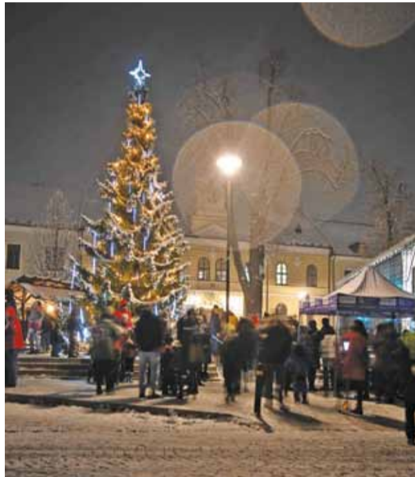
Vánoční strom v Bíteši.