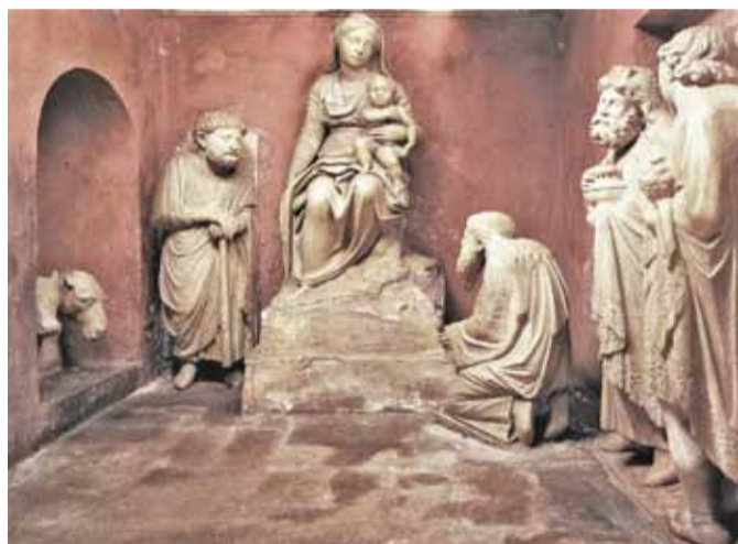
Betlém z mramoru od Arnolfo di Cambio, 1291.

Letos uplyne 800 let od postavení prvního vánočního betlému. Sestavil ho roku 1223 nadšený ctitel božského Jezulátka svatý František z Assisi. Byl zakladatelem řádu františkánů, prosazoval skromnost, lásku k bližním a přírodě. V lese poblíž italské vesnice Greccio zbudoval v malé jeskyni symbolický chlév s jeslemi, do kterých položil sošku Jezulátka. K jeslím přivedl živého osla a vola. U jeslíček potom spolu se svými řeholními spolubratry slavili v noci narození Spasitele, přizvali i vesničany. Na tomto místě byla sloužena první vánoční půlnoční mše. Tato myšlenka se zalíbila všem lidem v širokém okolí.