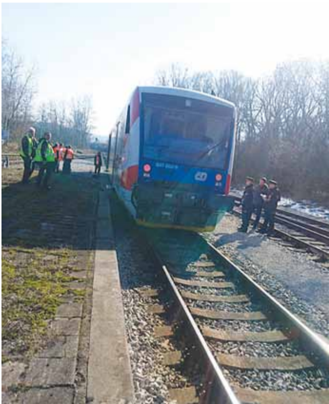
Vlak, který jel bez strojvedoucího z Martinic do Velkého Meziříčí, tedy asi šest kilometrů, a bez nehody překonal i mosty.

Jedenáct cestujících, ale také samotný strojvedoucí vlaku, si prožili svoje minuty hrůzy. Strojvedoucímu, který vystoupil ze soupravy v Martinicích, aby se údajně věnoval opravě, vlak samovolně odjel. Zastavil se až ve Velkém Meziříčí. Nyní probíhá šetření, proč vůbec k incidentu došlo, a jak to, že nefungovala ani záchranná brzda, kterou cestující zatáhli.