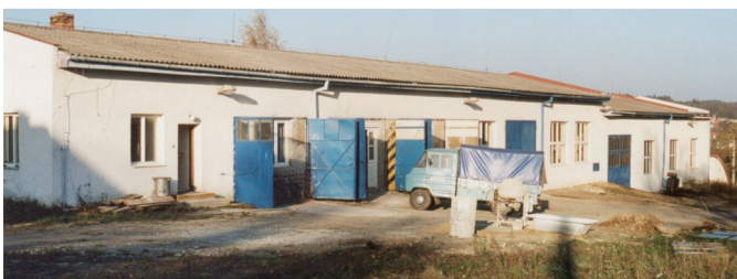
Původní prostory, které Prchalovi koupili.