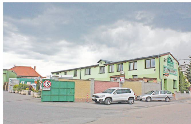
Sídlo firmy a prodejna ve VM.

dinné firmě totiž dělají všichni i to, co je momentálně potřeba.