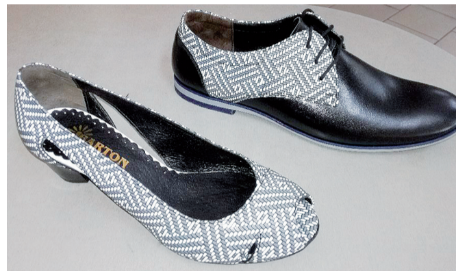
I takovouto nabídku najdete v prodejně Boty – Štipák – elegantní obuv českého výrobce ve stejném designu pro ženu i pro muže.

Jelikož jsme začínali v oboru, který jsme ani jeden z nás nedělal, já jsem byl veterinární technik a táta strojař, nebylo jednoduché vůbec začít.