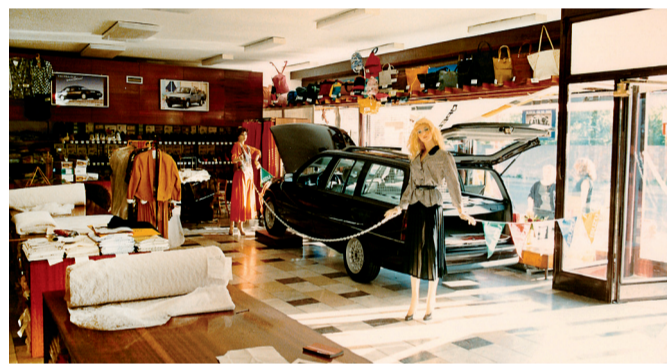
V Domusu Opel začínal.

Zdejší firma rozšířila také sortiment prodávaných vozů – v roce