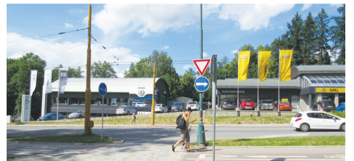
Na snímku autosalon v Jihlavě, který prošel rekonstrukcí v letošním roce. Zajišťuje prodej vozů Opel i Škoda. Autosalon ve Velkém Meziříčí byl opraven loni.

2003 o značku Chevrolet, kterou si mohli zákazníci koupit ve Velkém Meziříčí až do roku 2014, kdy Chevrolet ukončil své obchodní aktivity v Evropě. Další důležitý krok udělala firma v roce 2007, kdy zahájila prodej a servis vozů Škoda v Jihlavě.