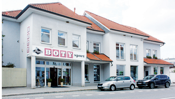
Nové sídlo rodinné firmy na Novosadech.

V prodejně si tedy na své přijdou, jak ženy, tak muži, děti i sportovci. Nakoupíte zde také peněžen-