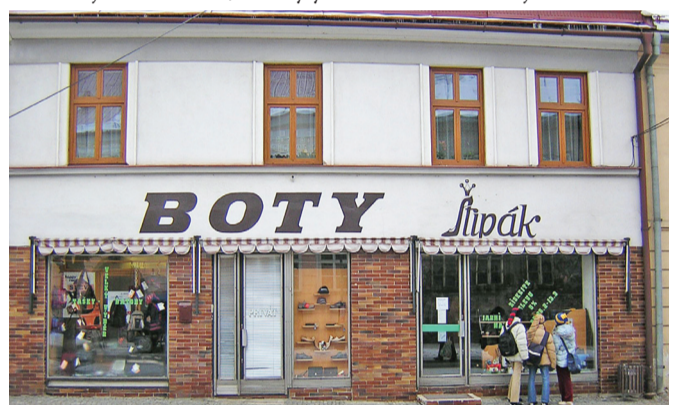
Původní prodejna na Komenského.