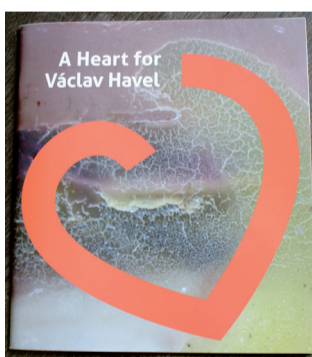
Brožura do USA.

programů Plesů v opeře Praha, propagační materiály pro Fotbalovou asociaci ČR, nyní na „cestu do Francie“ na Mistrovství Evropy 2016, ale kupříkladu i tiskem rodinných kronik ručně vázaných v efektní kožené či plátěné vazbě se zlatou ražbou a mnohými dalšími pracemi.