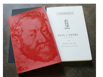
Program plesu v Opeře.

U této příležitosti vyjde v Medřičských listech speciální příloha.