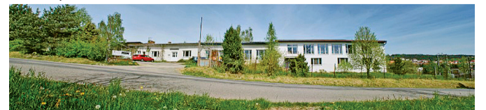
Současný areál tiskárny na Uhřínovské ul.

Letos v listopadu si firma připomene 25. výročí založení.