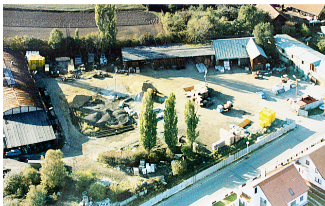
Pohled na někdejší areál na Oslavické.