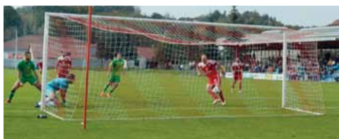
Šimrův vyrovnávací gól na stav 2:2 v 88. minutě utkání s Vyškovem.

Vyjádření trenéra Smejkala: Mrzí mě, že o neporazitelnost jsme přišli doma před vlastními skvělými diváky. Naši hráči se asi domnívají, že pokyny, které si dáváme v kabině před zápasem, nemusí plnit a hraje si každý podle svého uvážení. Bohužel to, co jsme dneska předvedli na hřišti, byl velký propadák a ostuda. Soupeř předvedl kolektivní bojovný výkon a zcela zaslouženě po právu vyhrál. Boji o čelo tabulky bude