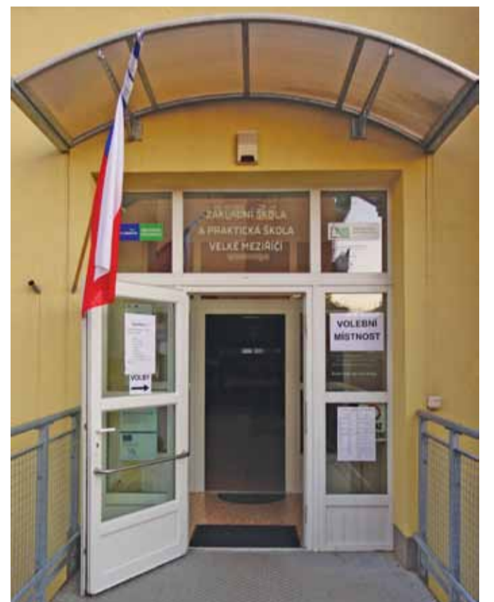
Do volebních místností si našlo cestu více lidí než v minulých komunálních volbách. Snímek je z ulice Poštovní ve Velkém Meziříčí.