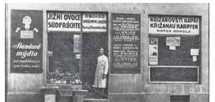
Foto dole: Prodej křižanovského kapra za druhé světové války v Brně.