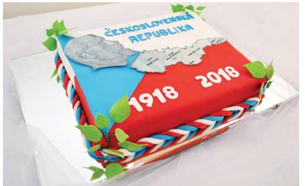
Cukrářský výrobek, který mohli návštěvníci vidět na letošním gastrodni hotelové školy ve Velkém Meziříčí, připomněl oslavy 100. výročí naší republiky. Nebyl jediný. I u dalších dortů se jejich tvůrci inspirovali tímto svátkem, který se bude slavit v neděli 28. října. Jednou z dalších akcí bude např. odhalení pomníku obětem světové války na Lipnici tuto neděli či sázení lip a další. Více čtěte na straně 3 a 5. (Více fotek najdete na straně 3 a na našem webu.)