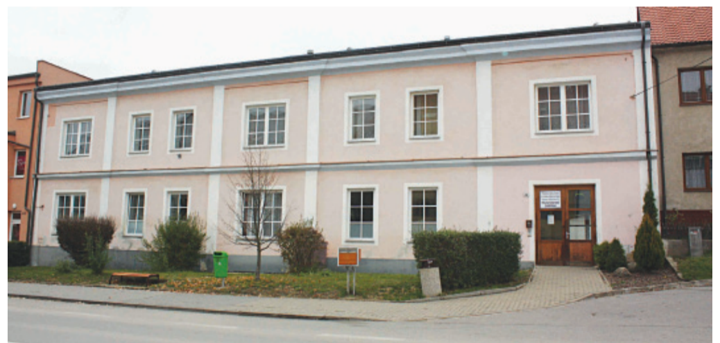
Zastupitelé jednali na minulém zasedání o využití internátu po bývalé zemědělské škole, který se nachází na Hornoměstské ulici.