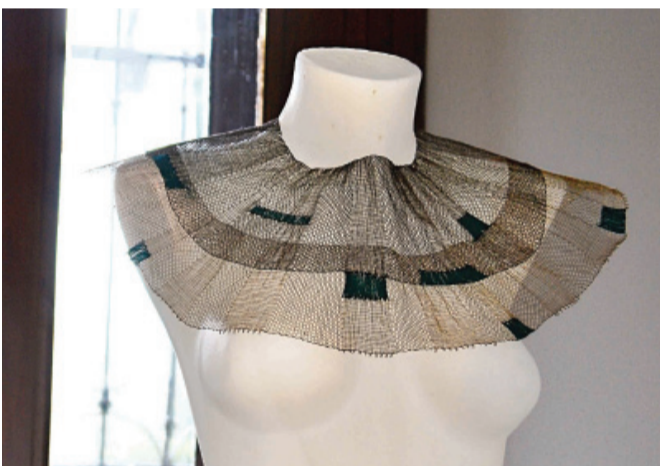
Výstava Obrazy a paličkové šperky v muzeu na zdejší zámku trvá do 31. 10. 2016.