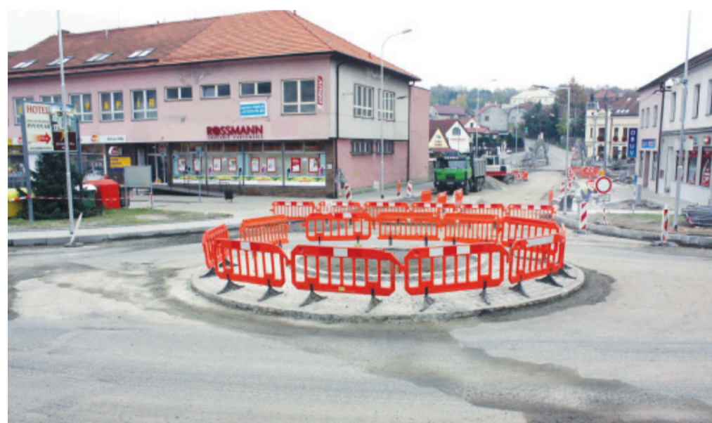
Řidiči z našeho města, ale i ti, kteří přijedou na podzimní prázdniny či na Dušičky, musí počítat s tím, že křižovatkou ulic Hornoměstská-Třebíčská o víkend neprojedou. Práce na nových površích mají skončit 30. 10.