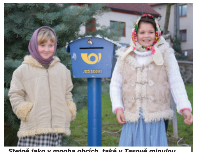
Stejně jako v mnoha obcích, také v Tasově minulou neděli zahájili advent. Kulturní program pak završilo rozsvícení vánočního stromu. Děti ale zřejmě nejvíce zaujala poštovní schránka "Ježiškovi".

Českomoravská Bezpečnostní Agentura spol. s r. o.