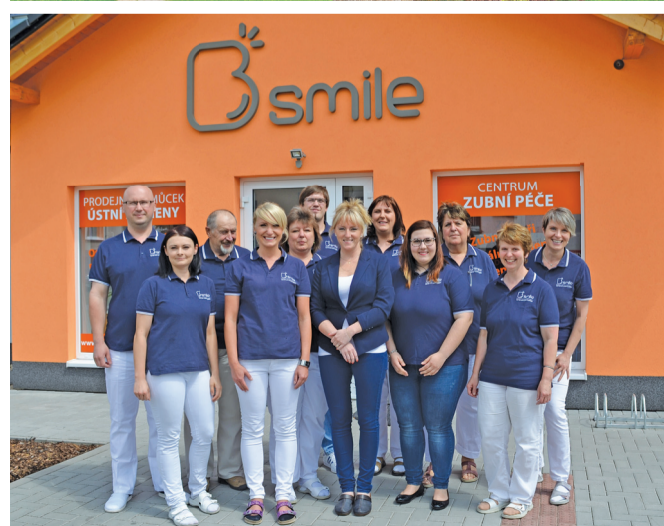
Náš tým - to jsou odborníci, které baví to, co dělají. Můžete se o tom sami přesvědčit.