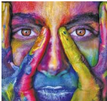
Moc velký, moc malý, moc zahnutý, moc pihovatý? Jsou důležitější otázky.

odpovídají za naše emoční chování. Proto zachycené vůně dokážou vyvolat emoce, vzpomínky, pocity bezpečí i ohrožení. Čich představuje to nejmimnější spojení s naším okolím a bez něj si připadáme zcela ztraceni. Každý, kdo během své covidové chvilky o čich přišel, teď určitě souhlasně přikyvuje. Vidíte, že nos je mnohem důležitější, než tušíme? Dýchání nosem přímým způsobem ovlivňuje kvalitu dechu. Kvalita dechu určuje kvalitu pohybu, řeči