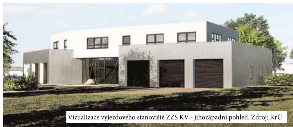
Vizualizace výjezdového stanoviště ZZS KV - jihozápadní pohled.

Návrh na darování pozemku p. č. 5917/25 a části z pozemku p. č. 5917/16, vše v k. ú. Velké Meziříčí do majetku Kraje Vysočina – to je jeden z bodů, které budou projednávat velkomeziříčtí zastupitelé na svém zasedání v úterý 27. února 2024.