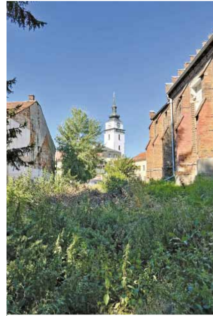
Nahore před úklidem, dole po.

Dobrovolnická akce na úklid kolem nové synagogy, kterou převzalo od Židovské obce do svého majetku město Velkého Meziříčí, se konala minulý týden. Šlo se na ní asi 30 dobrovolníků, kteří vyčistili zejména venkovní plochy kolem budovy. Měli ale možnost nahlédnout i do útrob synagogy, která by měla sloužit ke kulturním účelům. Na celkovou opravu si však památka počká – podle vyjádření starosty v médiích k tomu má dojít až v příštím volebním období. -red, foto: zdroj FCB AK, SpolVM-